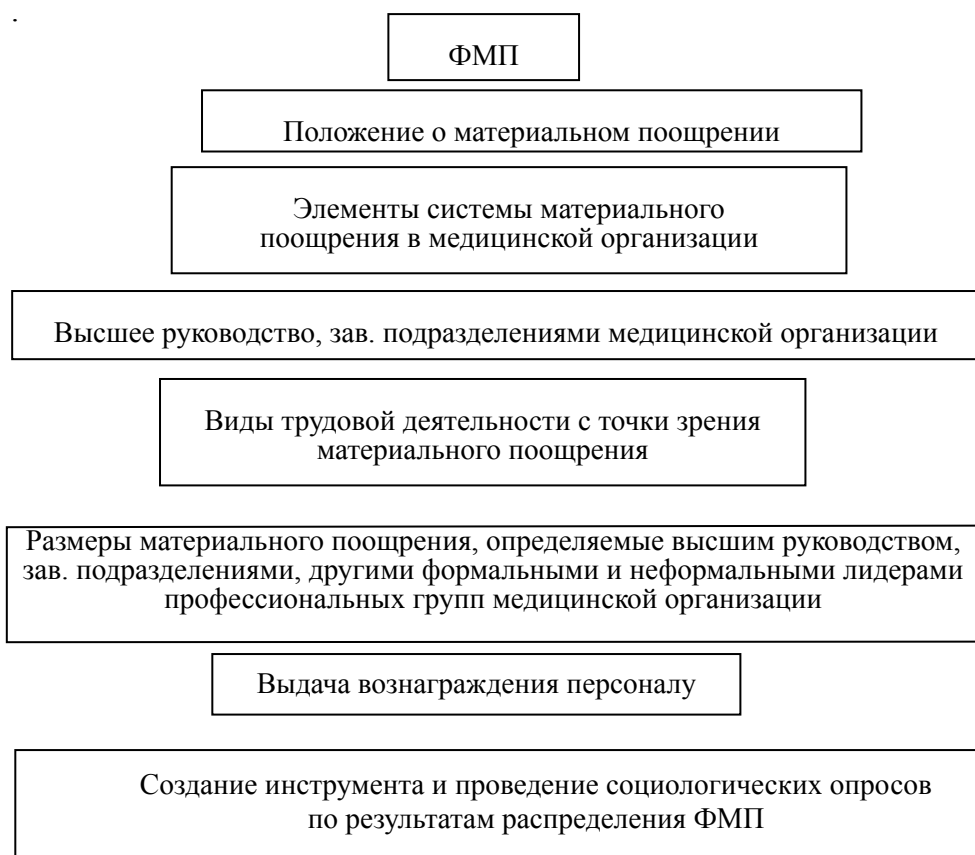
Рис. 1. Предлагаемая модель управления ФМП в Люберецкой районной больнице № 2

Предлагаемая модель управления ФМП в Люберецкой районной больнице № 2 приводится на рис. 1