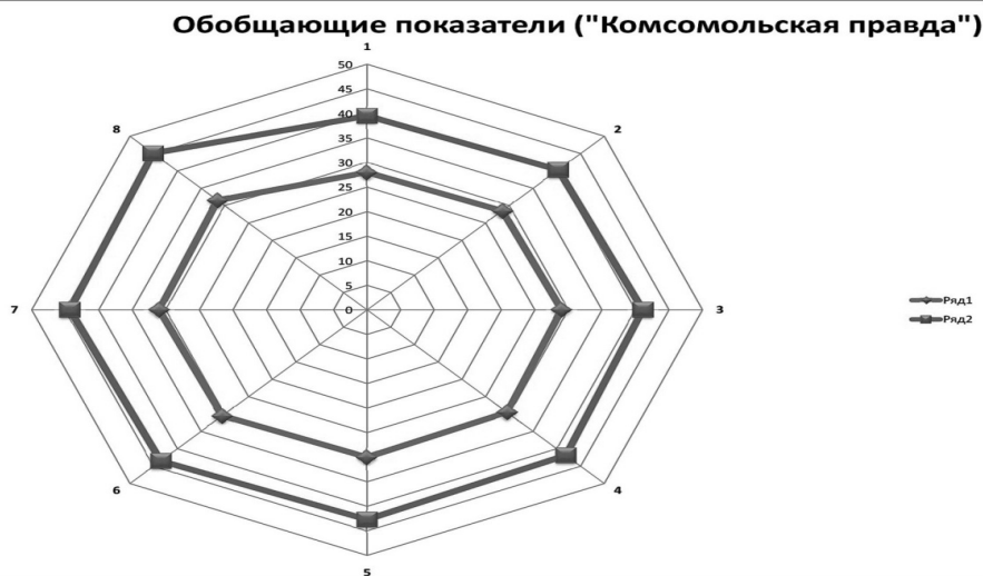
Рис. 3. Обобщающие показатели («Комсомольская правда»)

Использование графического метода позволяет наглядно выявить преимущественное преобладание коммуникативных критериев. Этот факт, полученный в результате проведения объемного исследования, наглядно доказывает правильность поставленной гипотезы. Исследование данного графика может также привести еще к целому ряду интересных и неординарных выводов, но уже не в данном контексте.