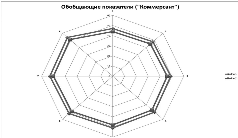
Рис. 5. Обобщающие показатели («Коммерсант»)

Сопоставление всех трех графиков приводит к следующим выводам.